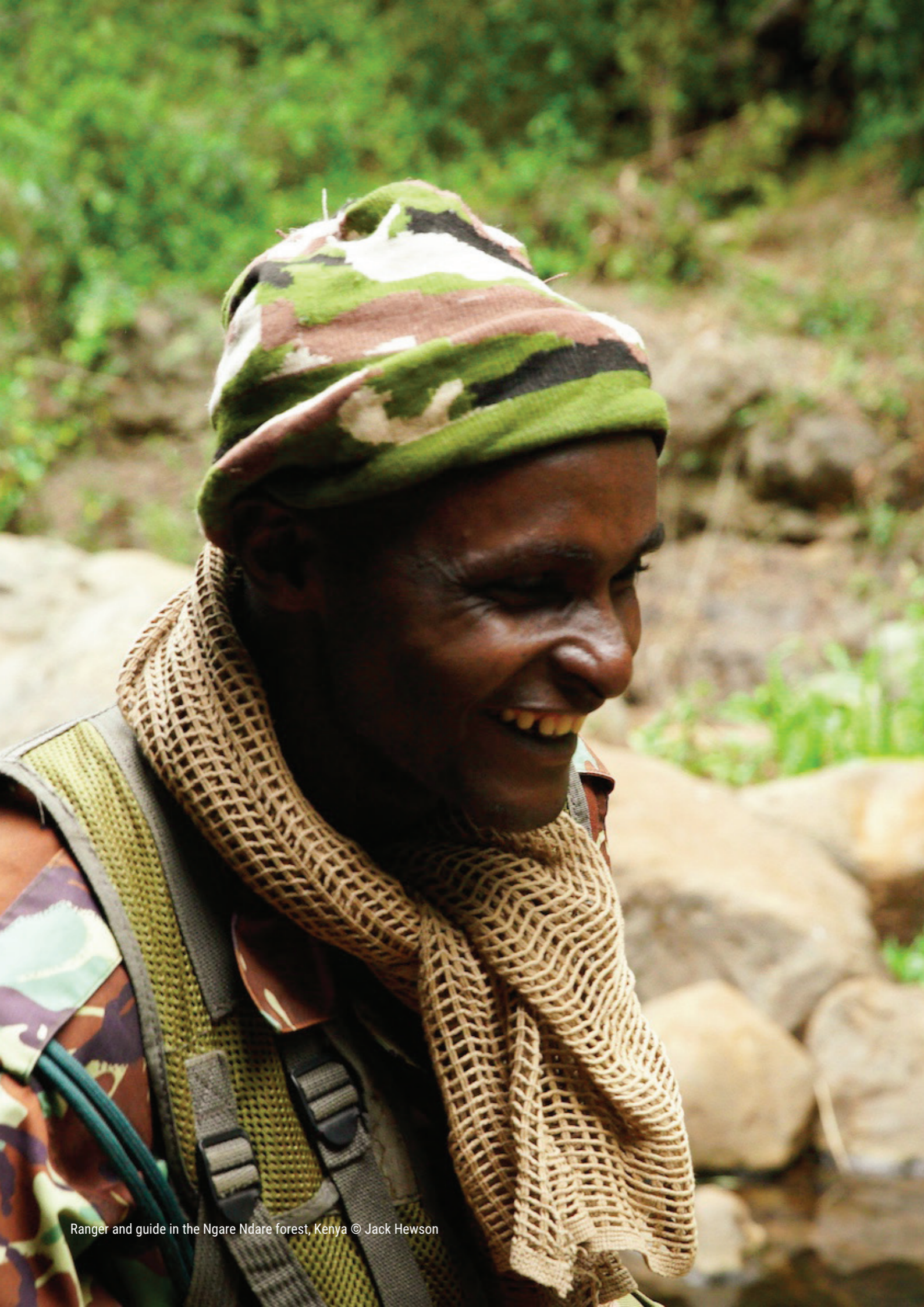
Ranger and guide in the Ngare Ndare forest, Kenya