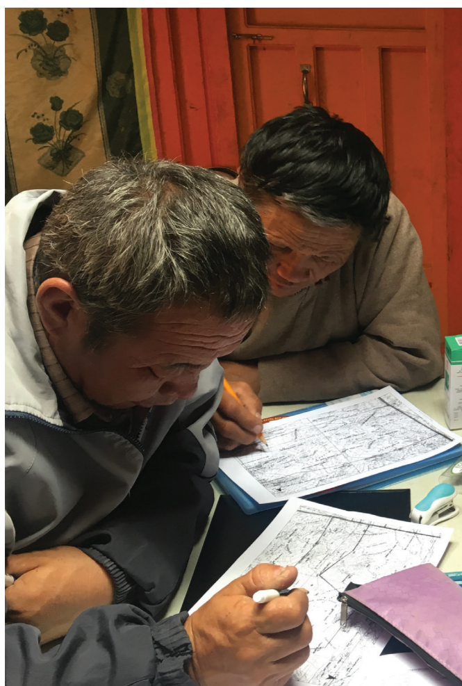
Community rangers in Tost Tosonbumba Nature Reserve, Mongolia preparing to go on patrol

Es evidente que hay que encontrar un equilibrio entre evitar la imposición de ideales o valores que vayan en contra de la cultura de un país o comunidad, y garantizar el respeto de los derechos humanos y valores como la equidad y la igualdad. Por ejemplo, en sociedades y comunidades patriarcales, puede haber oposición al empleo de guardaparques del sexo femenino (ver también la casilla 6). De hecho, en países donde es legal publicar ofertas de trabajo que especifican a solicitantes masculinos o femeninos, muchos trabajos para guardaparques se anuncian exclusivamente para varones. 26 El cambio vendrá tanto del intercambio de experiencias en todo el mundo como de un proceso de conversación, comprensión y posterior acuerdo para actuar, en lugar de imponer cuotas u otros procesos externos que no tengan en cuenta las normas y percepciones culturales.