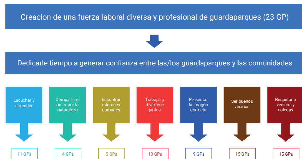
Figura 3: Un marco de trabajo para fomentar la confianza con las y los guardaparques y las comunidades, relacionado con las buenas prácticas

Comenzando con algunas buenas prácticas generales para crear una fuerza laboral de guardaparques diversa y profesional, éstas se desglosan en una serie de epígrafes (ver la figura 3) que agrupan a las buenas prácticas.