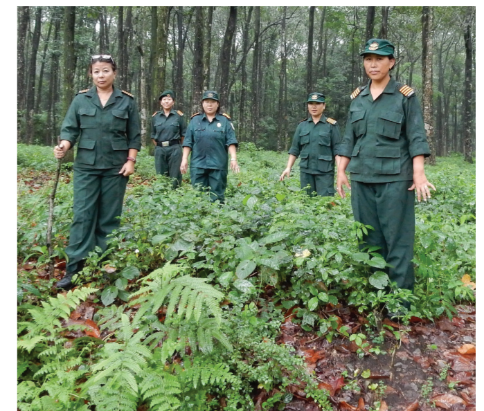
Women rangers in Bhutan