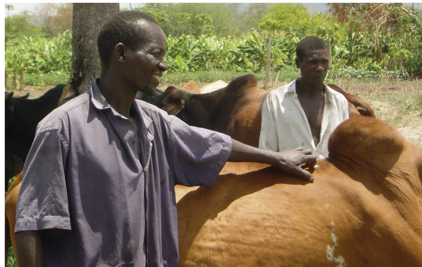
Ruaha National Park, Tanzania