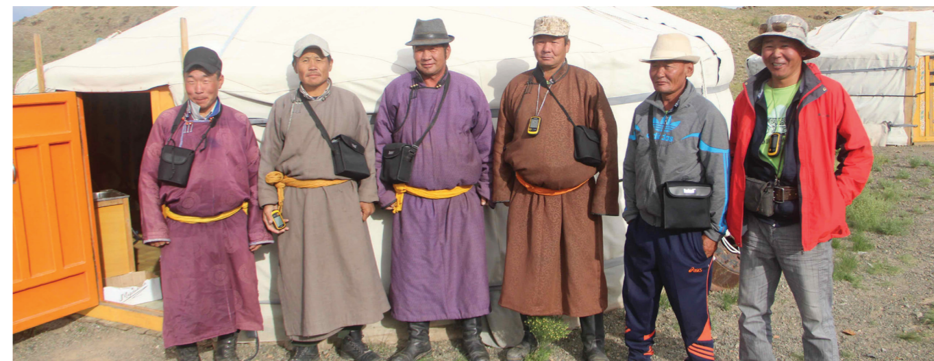
Community rangers in Tost Tosonbumba Nature Reserve, Mongolia

Las comunidades locales abarcan una amplia diversidad de personas y grupos, desde quienes viven en áreas protegidas o conservadas y que dependen de ellas para su sustento, hasta lugareños que usan el área con fines recreativos. El proyecto actual se enfoca en las personas que viven en áreas protegidas y conservadas, o en la vecindad, cuyo sustento y bienestar en alguna medida dependen del área o se ven impactados por las iniciativas de conservación que se están implementando en el área.