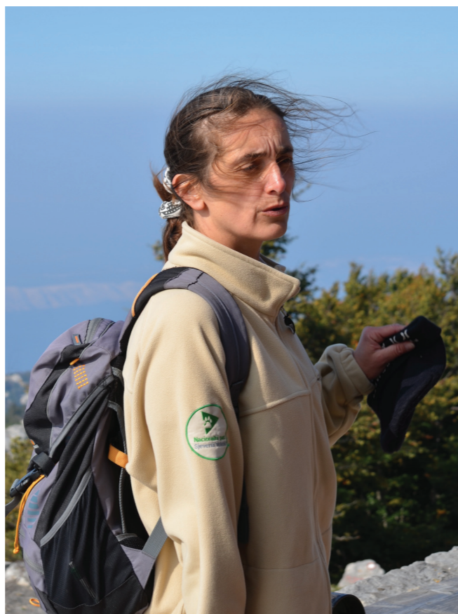
Photos (from top to bottom): Rangers based in Maharashtra, India, set out on patrol. Ranger in Northern Velebit National Park, Croatia