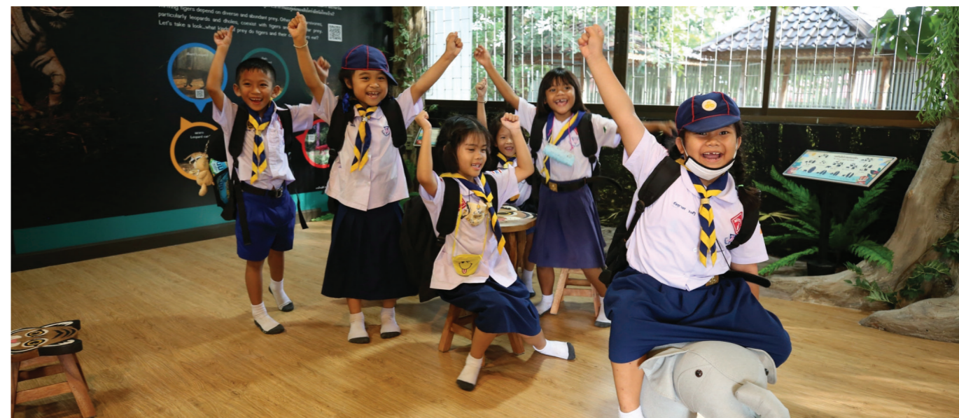
Rangers host conservation exhibitions and lectures for local people and school classes at the Tiger Learning Centre, Thailand

El resto de este estudio del alcance se enfoca en cómo se puede construir la confianza compartiendo las buenas prácticas recogidas de los profesionales de todo el mundo.