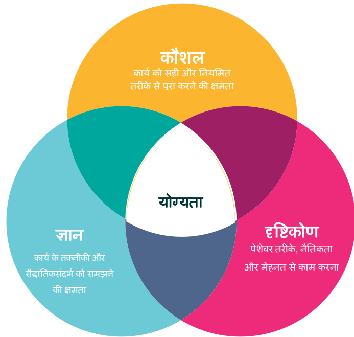
चित्र 3 - क्षमता के लिए कौशल-ज्ञान-दृष्टिकोण मॉडल 6