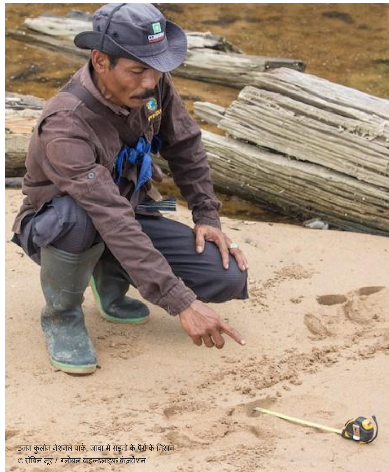
उज्ज्वल कुलोन नेशनल पार्क, जावा में राइतो के पैरों के निशान

नेतृत्व, संचार, टीमवर्क, गंभीर विचार, सिस्टम विचार, अनुकूलनशीलता