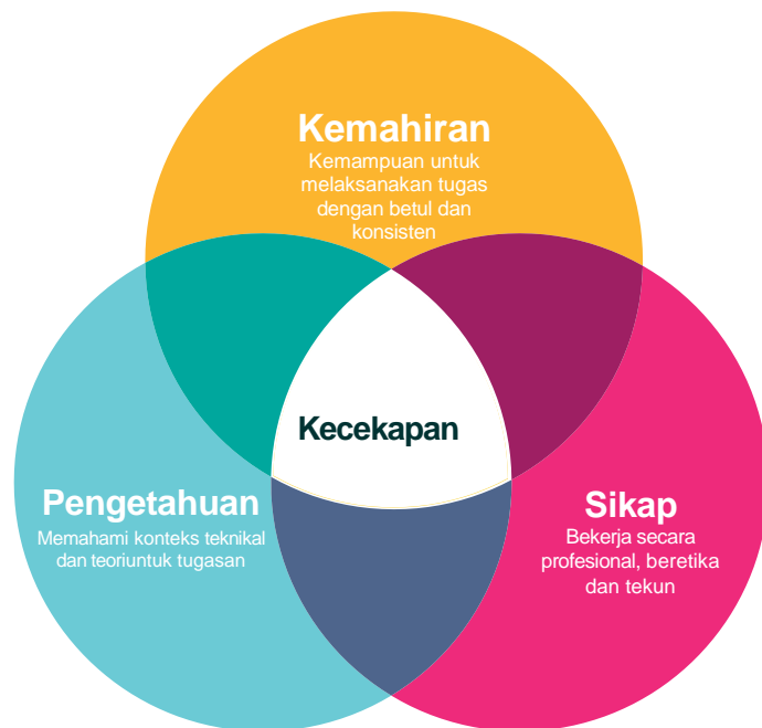
Rajah 3 - Model Kemahiran-Pengetahuan-Sikap untuk kecekapan 6

Kemahiran memastikan keupayaan untuk melaksanakan tugas dengan pasti dan konsisten; pengetahuan memberikan pemahaman tentang latar belakang teknikal dan teori kepada tugas; dan dengansikap yang betul seseorang individu menyelesaikan tugas dengan positif, profesional, beretika dan teliti.