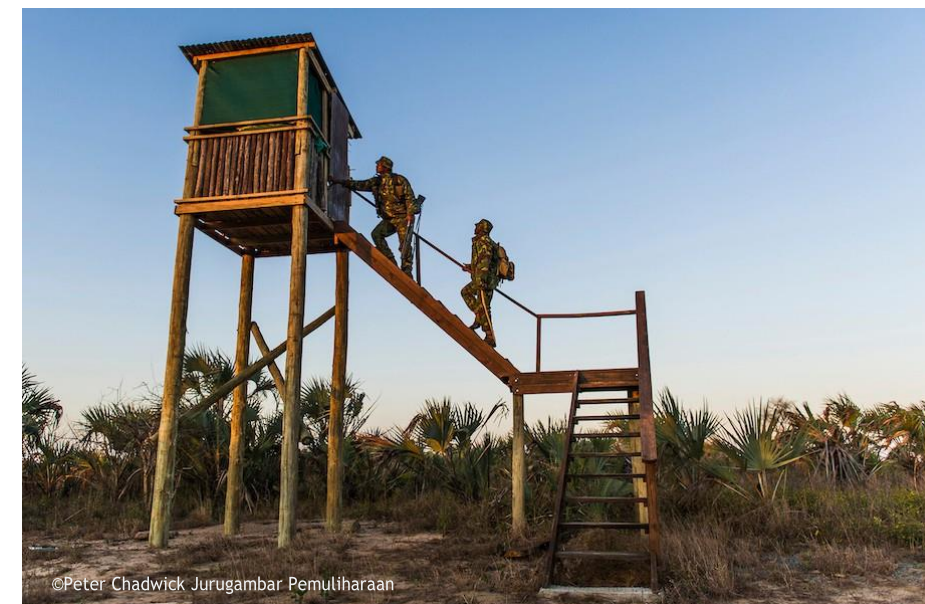
Jurugambar Pemuliharaan