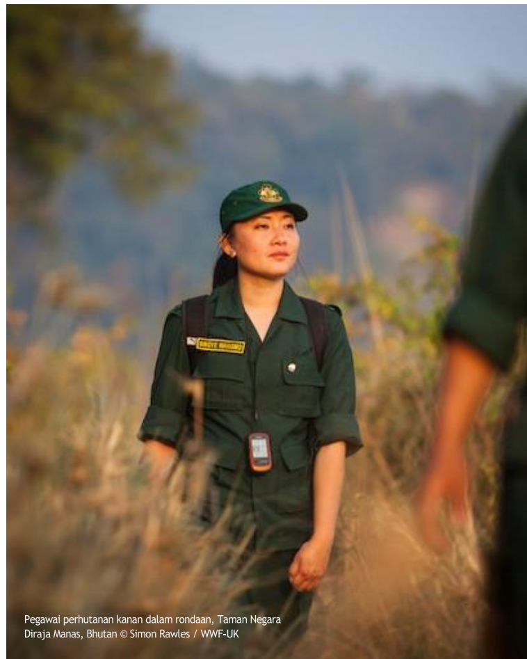
Pegawai perhutanan kanan dalam rondaan, Taman Negara Diraja Manas, Bhutan

Kepimpinan, Komunikasi, Kerja Berpasukan, Pemikiran kritis, Pemikiran sistem, Kebolehsuaian