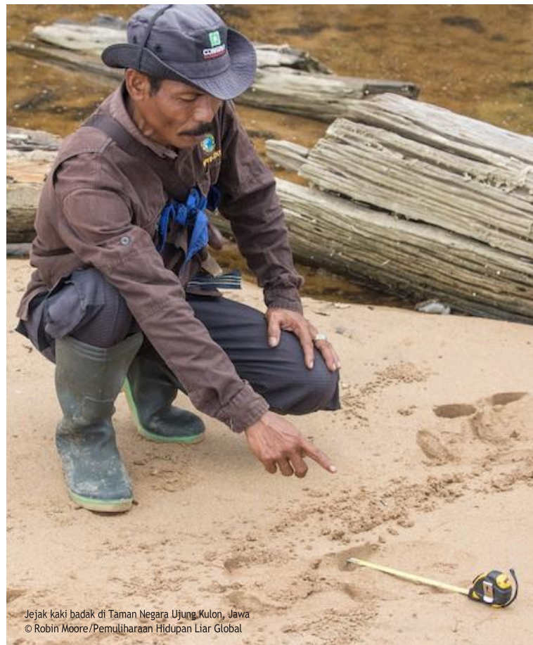
Jejak kaki badak di Taman Negara Ujung Kulon, Jawa