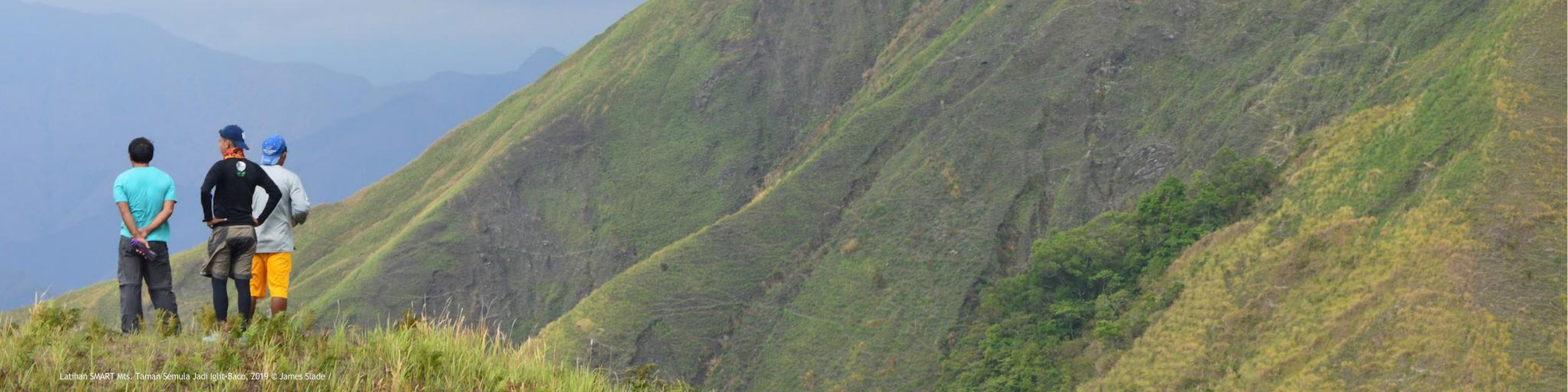
Latihan SMART Mts. Taman Semula Jadi Iglit-Baco, 2019